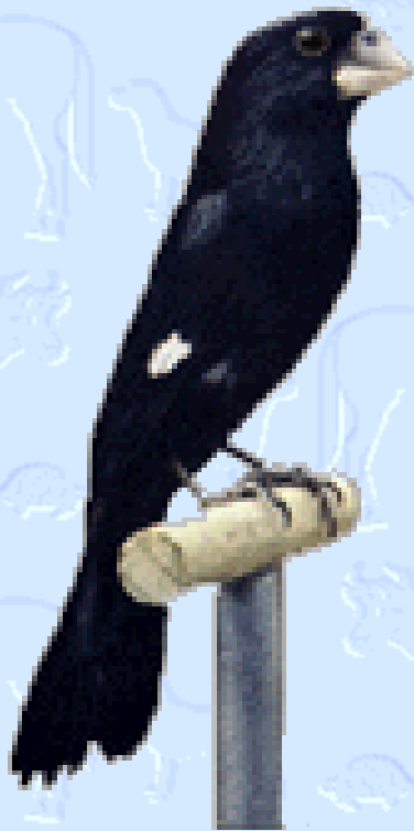
Bicudo do grupo dos bicudos