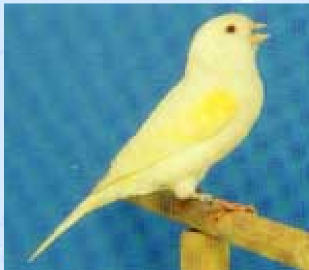
Canário - Serinus canarius

As doses usuais são de Cloranfenicol 80 mg/kg q8hs, ou 100 a 200 mg/litro na água de bebida; Tetraciclina 20 mg/kg q8hs, o que representa 55 mg/litro de água de bebida e Sulfaquinoxalina 500 mg/litro na água de bebida.