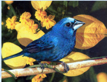
Azulão do grupo dos bicudos

The author makes a revision of the bird pet breeding and prophylaxis and he describes a alternative treatment for their diseases, verminosis, parasitism. The treatment with some different active products, given month by month a new doses and new products for health maintain. This description is the most recent and complete treatment used by the author's clinic.